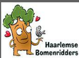
Stichting Haarlemse bomenridders