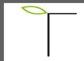
Stichting Tuin van Haarlem