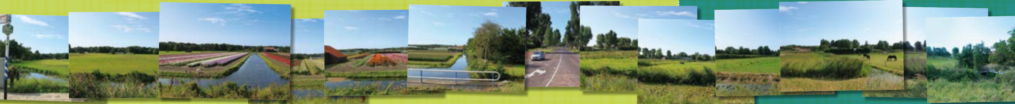
Vanaf Oosterduin strekt het Westelijk Tuinbouwgebied zich uit.